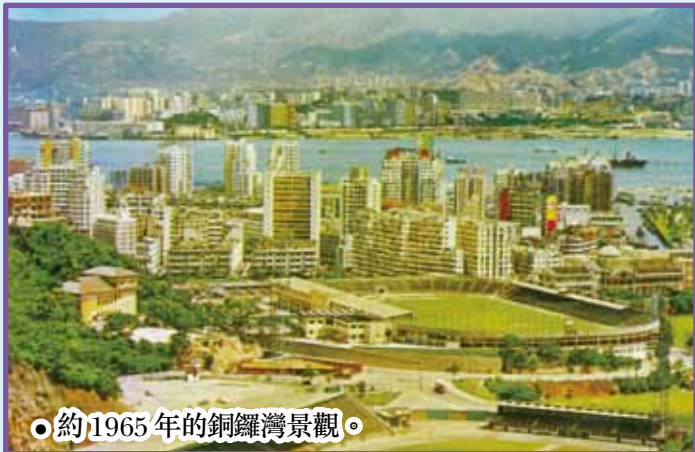
約 1965 年的銅鑼灣景觀。

院和醫院，其前方維多利亞公園左旁可見一運河，是供牛奶公司冰廠運冰過海者。運河稍後填平以關延伸的告士打道；至於牛奶公司的建築，則於 1960 年代末開始陸續拆卸，改建為珠城大廈，恆隆中心以及現「皇室堡」所在的皇室行。