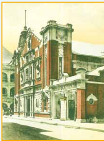
• 約於1915年的域多利戲院。