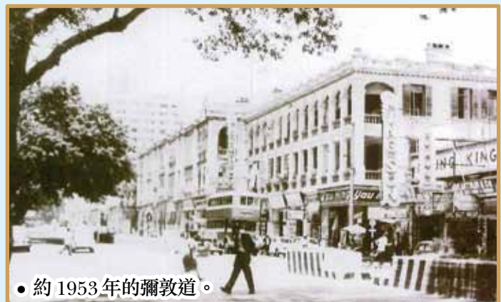
● 約 1953 年的彌敦道。

廈」。樹後有鐘塔的大廈，是位於金馬倫道口落成於 1951 年，當時九龍最高的電話大廈，1980 年代初，改建為匯豐大廈。這一帶是著名的旅遊區，但主要的彌敦道仍十分僻靜，部份馬路中心是可供泊車，現時看來是不可思議的。