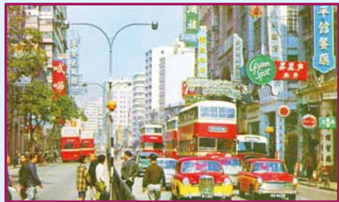
● 約 1964 年的彌敦道，右方為太平館餐廳。

平安酒樓所在是落成於 1960 年的平安大廈，其前身是建成於 1934 年的平安 ALAAMBRA 戲院。