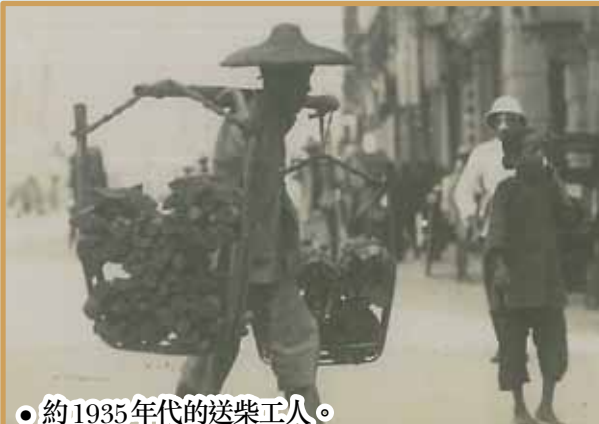
約 1935 年代的送柴工人。

由 1950 年代起，柴炭漸被「火水爐」、「石油氣爐」、電爐及煤氣所取代，「擔柴佬」亦從街道上消失。