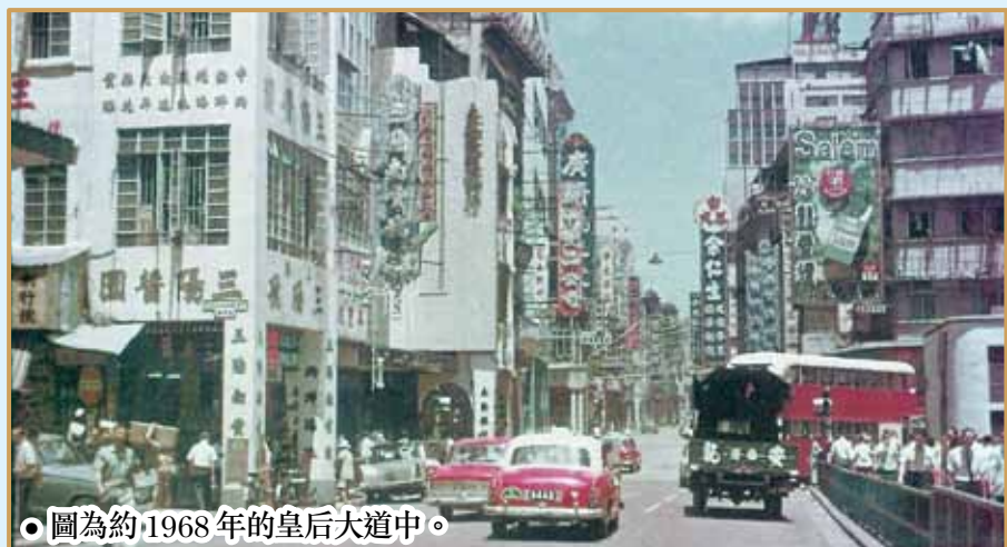
圖為約 1968 年的皇后大道中。

三陽及華豐的樓宇於 1992 年被拆卸，以架設登山扶手電梯，於 1994 年落成。