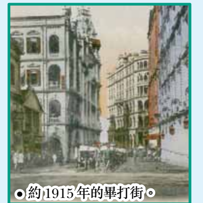
● 約 1915 年的畢打街。

改建為「於仁大廈」，即現遮打大廈所在。右方為由頗地洋行建築於 1892 年（紅色），及 1909 年（淺藍色）改建成的新「香港大酒店」，現時為置地廣場及中建大廈。