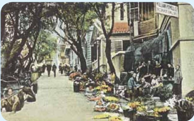
約 1910 年的雲咸街，亦稱為「賣花街」。