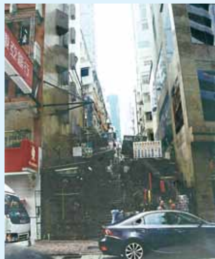
●現鴨巴甸街附件一帶。