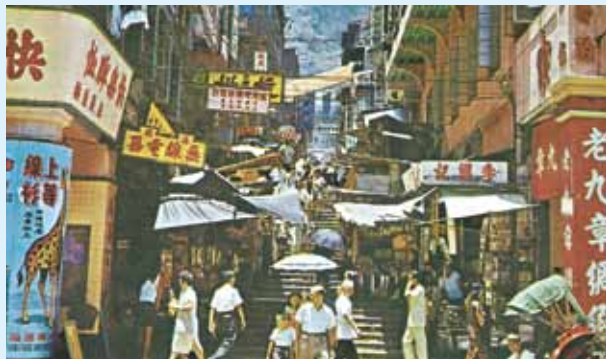
●由皇后大道中向上望，約1965。

約1982年轉變為第二代蓮香茶樓。蓮香約於1997年再遷往左中部「明興五金」的地段。