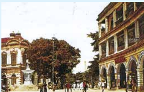
● 約 1910 年由銀行街東望一帶。

正中為位於下環皇后大道東 (這一段約於 1970 年易名為金鐘道) 海軍船塢 (現今鐘站一帶) 的煙囪。