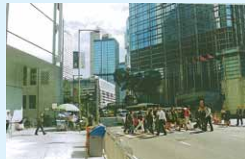
● 現時中下環交界景。

1933 年，大會堂拆卸，部份售予匯豐銀行興建各位都有印象，於 1981 年拆卸的第三代總行，餘下部份於 1947 年拍賣，由中國銀行購得，興建總行大廈，於 1951 年落成。