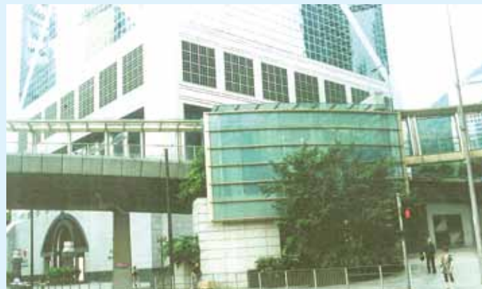
● 現時中銀大廈所在地。