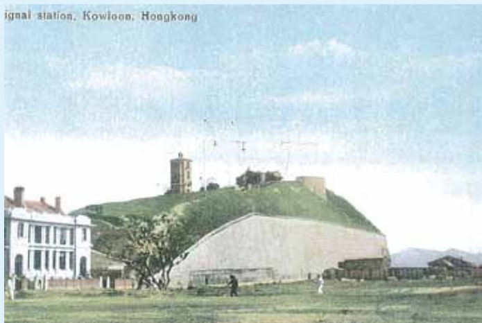
約攝於1951年的尖沙咀訊號山，又名「大包米」。

到了1933年終才取消。前方的地段曾舉辦多屆工展會，現時為停車場及喜來登酒店所在。