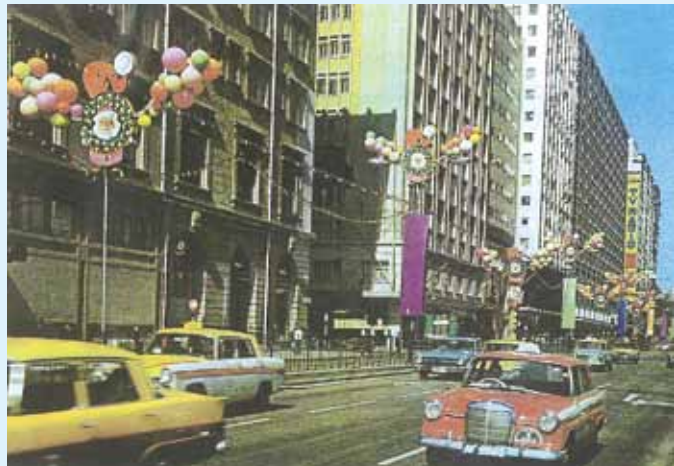
● 約1966年的尖沙咀彌敦道。

右方的廣場曾於1940至1963年期間，舉辦過多屆工展會，於1973年建成喜來登酒店。