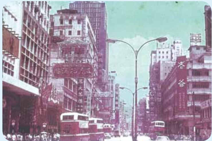
● 約 1969 年的旺角彌敦道。